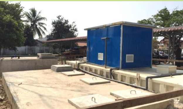
污水处理装置完工情况