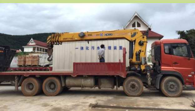
一体化污水处理装置运输放置情况

在澜湄合作基金支持下，澜沧江-湄公河环境合作中心联合澜沧江-湄公河环境合作云南中心等有关单位，于2018年为老挝南塔省省立中学捐赠并安装了一套日处理50吨的一体化污水处理装置，建成后学校生活污水处理率达到100%，处理后废水可循环利用，无外排，二次污染等问题。