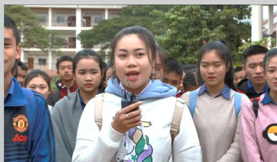
南塔省省立中学学生代表

南塔省省立中学学生代表在交流中表示：“我想对中国生态环境部帮助我们学校建立污水处理池表示由衷的感谢，因为这个污水处理池对我们来说有很多作用，比如可以用来浇灌校园内的花草树木，或是用作冲洗用水。”