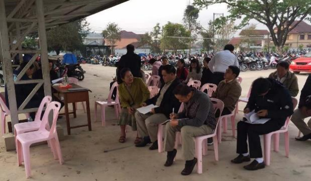
污水处理设备使用培训现场

项目建成后，为保证建设项目的运行与维护，建设单位对南塔省省立中学管理人员进行了设备原理及使用方法培训，并开展实际操作训练与答疑，保证培训质量。