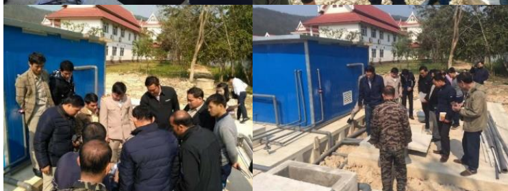
中方人员向老方人员讲解设备控制系统和操作方法