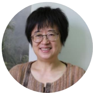
吕植 北京大学生命科学学院教授

应对气候变化行动需要社区部门的共同参与。通过将传统智慧和科学研究相结合，并同步加强适应性管理，才能更好的促进生态系统恢复。在部分地区已经有通过开展草地恢复行动，以本土放牧智慧对沙化草地进行恢复治理的良好案例，并为其他区域提供了借鉴。相比围封禁牧，这种结合了传统放牧智慧的草地恢复治理措施更为有效，合理放牧使得草地植物群落盖度、物种丰富度、和生物量均显著增加，有利于沙化草地更快恢复。